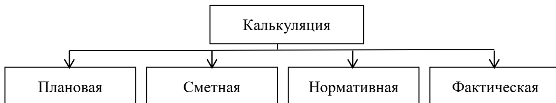
Рис. 1.1. Виды калькуляций

В зависимости от целей калькулирования выделяют следующие виды калькуляций (рис. 1.1).